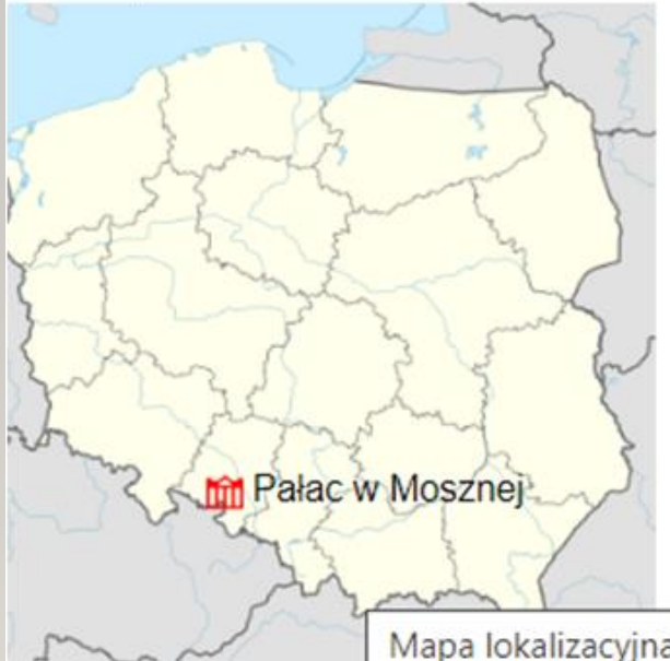
Położenie na mapie Polski