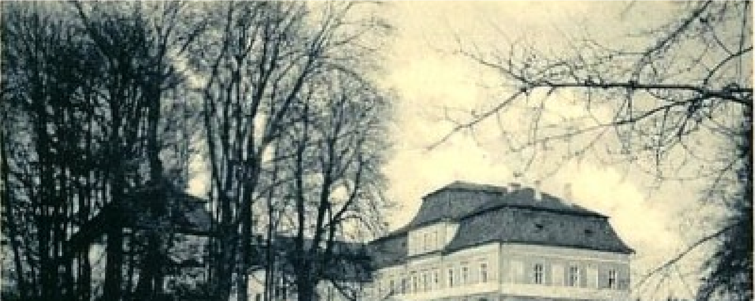
Pałac z 1837 rok - Dobrosławice