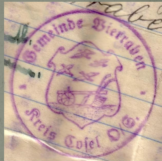
Odcisk z 1937 roku