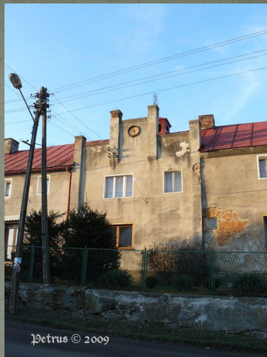
Petrus © 2009

Pozostałości dawnych zabudowań gospodarczych przy pałacu.