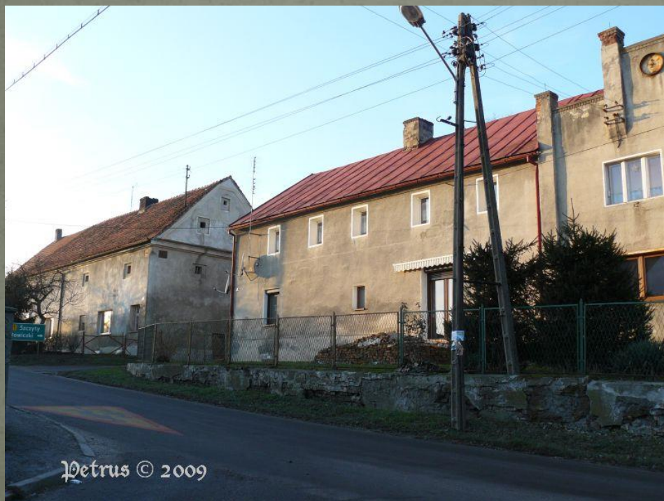
Petrus © 2009