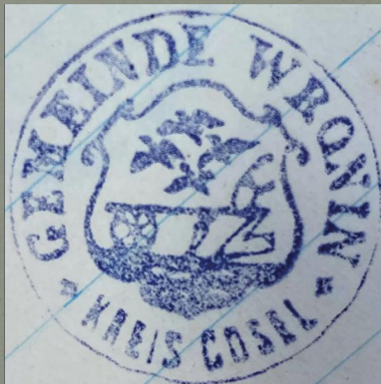
Odcisk z 1927 roku