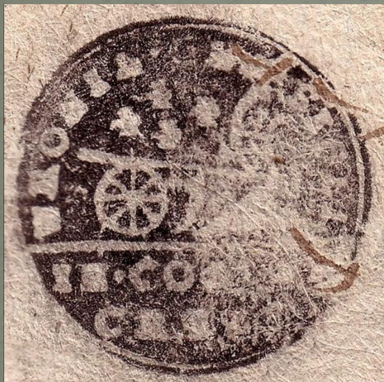
Odcisk z 1823 roku